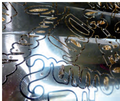
Ci-dessus, lettres découpées à la fraiseuse.

Il fallait tout d'abord réformer la production, introduire la robotisation dans les chaînes de fabrication et perfectionner le circuit industriel, depuis la prise de commande jusqu'à la livraison. Un atelier d'articles en bronze nécessite une cascade d'étapes techniques pour transformer la pièce brute en article fini. Aujourd'hui, l'intervention manuelle est réduite au maximum. Les robots de découpe interviennent avec une précision quasi parfaite et ensuite, les pièces sont ponçées et vernies par de nouveaux robots